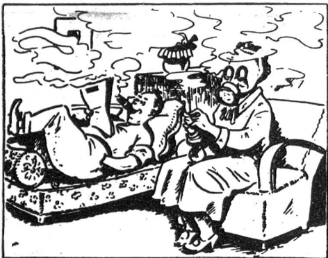
„Nun kannst du qualmen, so viel du willst.“

Am Morgen nach dem Fest sieht Blum in den Spiegel. „Höre mal, Marie“, sagte er zu seiner Frau, „ich habe hier auf der Zunge eine ganz scheussliche Blase, sieht aus wie verbrannt.“ — „Kein Wunder“ meint Frau Blum, „heute nacht, wie du heimgekommen bist, wolltest du ja unbedingt aus der Wärmeflasche auf meine Gesundheit trinken.“