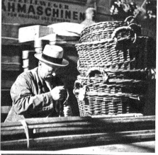
Unten: Ein alter, lieber Freund des Pächters. Dieser Landwirt kommt schon seit 27 Jahren hierher und ist zusammen mit dem Pächter alt geworden

kleinen Blütenkelch. Peter streckt unwillkürlich seinen gesunden Arm danach aus und sieht mit glänzenden Augen zu, wie die Pflegerin das Blümchen sucht an seine Seite auf dem Bett-Tisch stellt und aus den dichten Blättern ein kleines Kürtchen löst. Es steht nicht viel darauf: Denk an unsere Berge! Wenn die Alpenrosen blühen, sind wir wieder oben. Mut! Dein Seilkamerad — Hans.» Zum erstenmal in seinem bewussten Leben empfindet Peter die aufsteigenden Tränen nicht als üble Schwäche, und er schämt sich auch nicht vor der kleinen Schwester, die gerührt seine feuchten Wimpern sieht. Lange