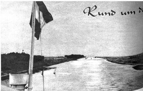
Zwischen endlosen Flächen braunen Wüstensandes gleitet das Schiff durch den Kanal

Der Junge hat sicher recht. Beides ist wahr: die Flasche ist halbvoll, aber auch halbleer gewesen. Ich hatte doppelt recht — die Pessimisten haben meist immer unrecht. Ihre Gesichtspunkte gehen von falschen Voraussetzungen aus. Ich sage zum Beispiel lieber, mein Mann habe eine sehr hohe Stirn als: «Er hat eine schon beginnende und frühzeitige Glatze». Er hat eine wunderbare Stirn. Und ich habe ihn gerade gern mit seiner übermäßig hohen Stirn, die zu ihm gehört. Und seit ich die Probe mit der Flasche bestanden habe, glaube ich doppelt daran, dass es richtig ist, wie ich denke. Der Trick mit der Flasche könnte ja auf unzählige Fragen im Leben angewandt werden, und ich möchte immer auf der rechten Seite stehen. Vielleicht entgegenen Sie mir, das sei ein loses Spiel mit Worten. Aber Sie haben unrecht: die Menschen sind und werden so, wie wir mit ihnen umgehen, und was wir aus ihnen machen. Wohin kämen wir mit unserer Liebe, wenn die Flasche immer halbleer wäre? Zum Optimismus gehört die Kraft der Liebe. Sie lässt uns die Flasche halbvoll sehen, wenn sie in Wirklichkeit ebenso halbleer ist. Und wie steht's mit demer, mit Ihrer Flasche...? E.I.