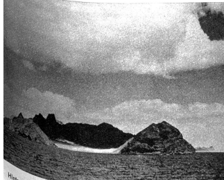
Hinter steilen Felswänden geborgen liegt der britische Flottenstützpunkt Aden, der den Eingang in den Indischen Ozean beherrscht

Rechts: Arabische Händler klettern an den Masten ihrer Segelboote an, um ihren Kram auch dann an den Mann zu bringen, wenn das Betreten des Schiffes verboten ist. Links: Selbstbewusst schauen die arabischen Frauen in die Welt, seitdem sie nicht mehr gezwungen sind, unter schwarzen Schleier ihre Schönheit zu verbergen