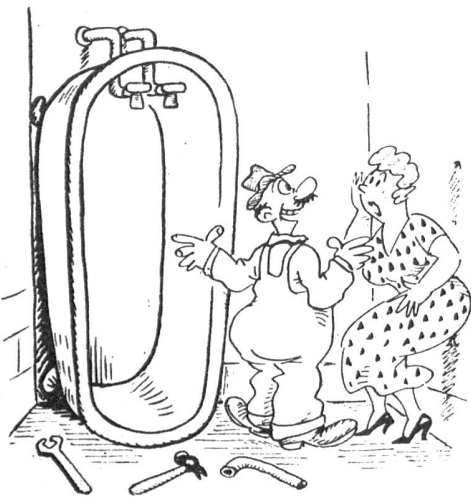
„Das Badezimmer war zu klein für eine Wanne, darum habe ich dafür eine Brause gemacht!“