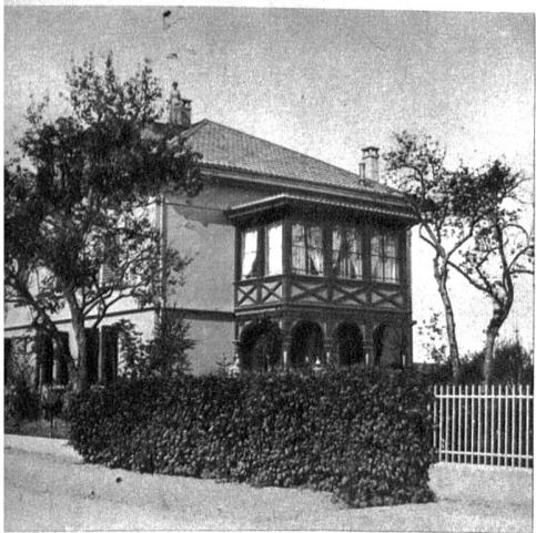
Das Doktorhaus in Herzogenbuchsee, Maria Wasers Elternhaus.

«Land unter Sternen», in diesem Preislied auf die echte Gemeinschaft einer wahrhaften Dorfsame und das vorbildlich gesetzliche Leben der Hügelbauern. Die oberaargauische Landschaft und die einprägsamen Buchsigestalten geistern aber schon durch die Novellen, im Epilog der «Narren» und im Hodlerbuch, leuchten noch einmal geheimnisvoll auf im Traumlicht der letzten Werke, im «Sinnbild des Lebens» und in den Blumengedichten. Weit über die Schweizergrenze hinaus ist Herzogenbuchsee durch diese Dichtungen berühmt geworden; auch ausserhalb des deutschen Sprachgebietes leben Buchsitypen, wie das «Jätvreni», durch französische und rätoromanische Uebersetzungen im Bilde fort.