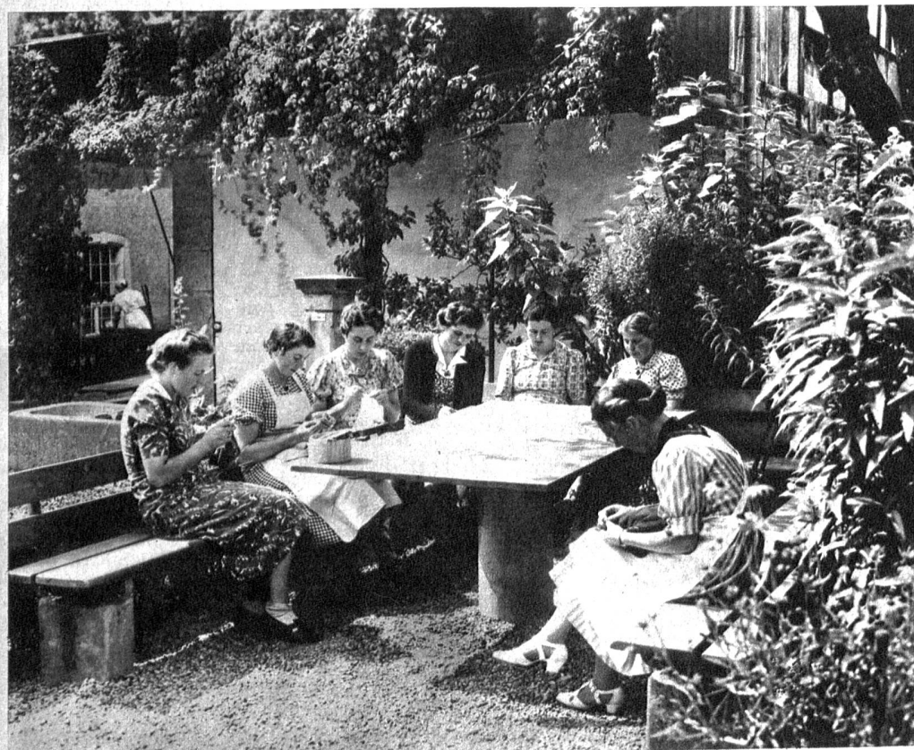
Die Schülerinnen im Garten des „Kreuz“

Moser in den Kreis derjenigen gezogen zu werden, denen sie für ihre Arbeiten und Pläne das Vertrauen schenkte, der wird dem Eindruck nie vergessen, den diese geistig vornehme und dann doch wieder demütig bescheidene, aber allezeit unverzagte und vom echtem Gottvertrauen und wirklicher Aufopferungsfähigkeit beseelte Frau auf alle ihr näher Stehenden gemacht hat. Vor einundzwanzig Jahren ist sie hochbetagt heimgegangen. Ihr Werk ist geblieben, ihr Andenken lebendig bis auf den heutigen Tag. Möge ihr Beispiel in den Herzen der Schweizerfrauen auf alle Zeiten weiterleben und sie zur erfolgreichen Weiterführung ihrer Aufgaben anfeuern. Dr. H. D.