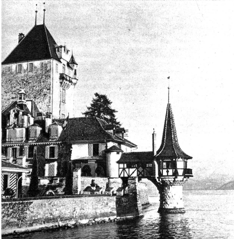
Oben: Frühlingspracht am Thunersee