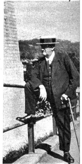
Er sieht gar nicht so humoristisch aus, wie man ihn schildert. — Hundert solcher Menschen könnten einem auf der Strasse begegnen, ohne dass man sich darum kümmern würde