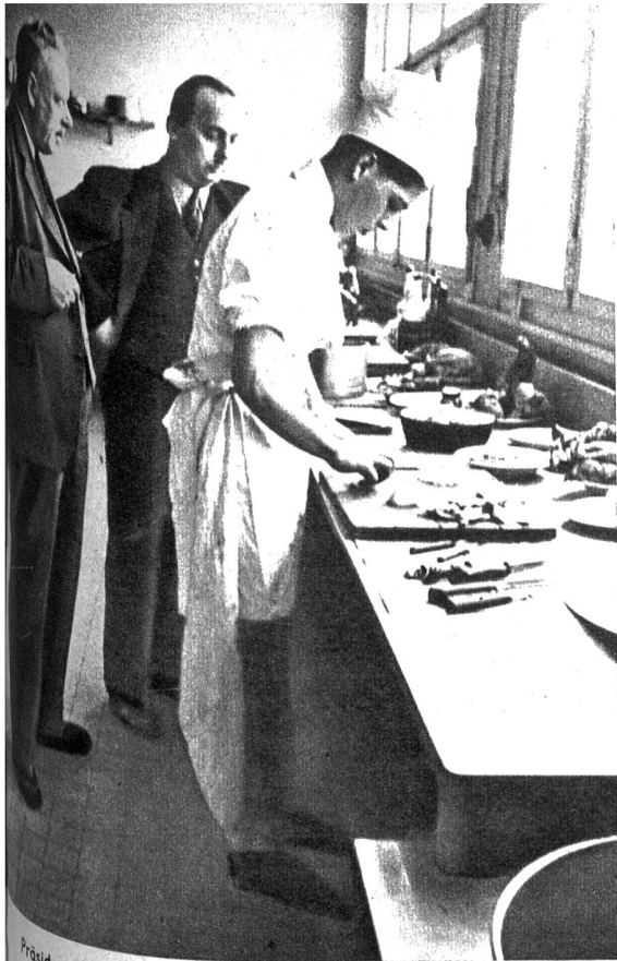
Präsident und Vizepräsident der Prüfungskommission beobachten einen Prüfling bei der Arbeit