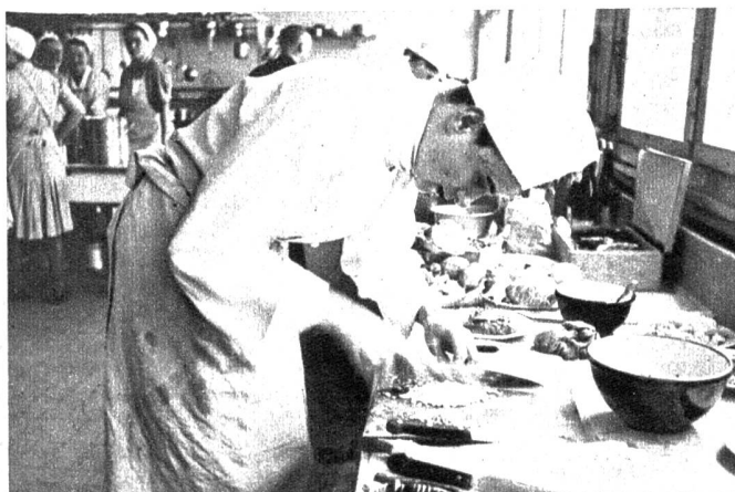
Rechts aussen: Ein Blick in die geordnete Schulküche

Die Berufsberatungsstellen, wie auch das Sekretariat der kantonalen Prüfungs- und Kreiskommission für das Gastgewerbe, Kramgasse 2, Bern, geben gerne jede gewünschte Auskunft. Die gute Leistungsfähigkeit und die grosse volkswirtschaftliche Bedeutung des Gastgewerbes setzen einen hochstehenden Berufsstand voraus.