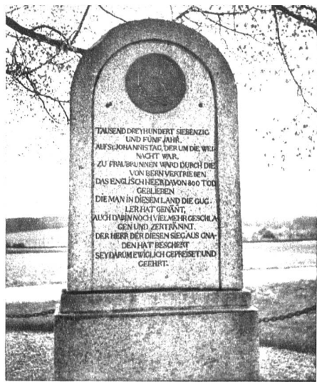
Das Gugler- und Franzosendenkmal bei Fraubrunnen

Das Gugler- denkmal bei Frauen- brunnen, an der Solo- thurner Strasse, zur Er- innerung an den Sieg der Bern über die Gugler, am 27. Dezember 1375. Der blutige Kampf hat bei Mauern der jetzt zerfallenden dienenden Ge- meinde des Klosters Frauen- brunnen stattgefunden. Das Gedenkmal aus Stein mit deutscher und französischer Inschrift wur- de errichtet und ist 1898 umgewandelt worden. Das steinerne Denkmal datiert vom 24. Juni 1824