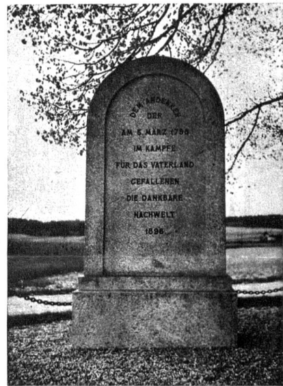
Das Franzosendenkmal, als Erinnerung an das daselbst verlorene Gefecht vom 5. März 1798, errichtet. Eine uralte Linde hat bis 1895 dort gestanden, sie ist nun ersetzt wor- den

Der in Fraubrunnen residierende Land- vogt erschien nicht, um Napoleon seine Aufwartung zu machen. Er schickte aber seinen Sohn, um den hohen Gast zu be- grüssen. Der General teilte diesem mit, dass ihm die Engländer nach dem Leben trachteten und verlangte ein Geleite, das er das bernische Gebiet ohne Unfall be- reisen könne. Hierauf soll er nach dem Zeugnis eines seiner Begleiter im Lehn- stuhl für kurze Zeit eingeschlummert sein. Nach Mitternacht bestieg Napoleon seinen unterdessen reparierten Reisewagen wie- der und fuhr, von Bauern in weissen Zipfmützen begleitet, nach Lohn, wo ihn der Abgeordnete der Solothurner Regie- rung in Empfang nahm. Im folgenden Jahr läutete dem alten Bern die Totenglocke. Die französischen Heere brachen in die Schweiz ein. Von So- lothurn und Freiburg bedrohten die Fran- zosen die Mutzenstadt. Durch höchst un- glückliche diplomatische und militärische Dispositionen hatte die Patrizierregierung ihren Staat in eine aussichtslose Lage hin-