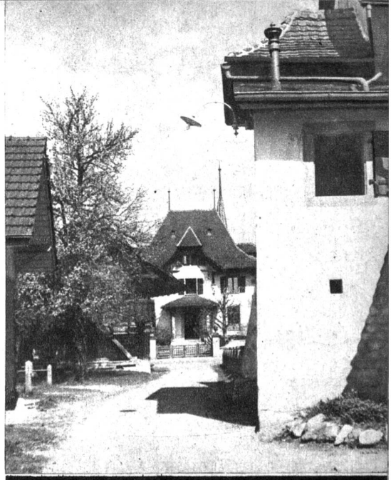
Blick vom Kloster auf die Amtersparniskasse