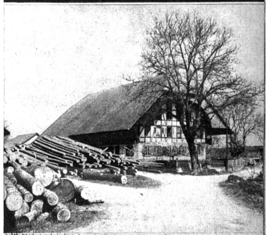
Die Sägerei in Fraubrunnen