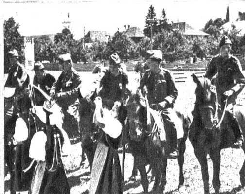
Flotte Dragoner an der Sprungkonkurrenz in Fraubrunnen