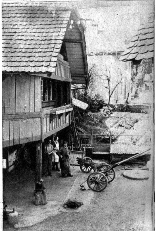
Die ehemalige Klosterschmiede. Das Gebäude stammt noch aus der Klosterzeit