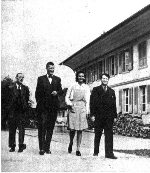
Die Lehrerschaft von Fraubrunnen beim üblichen Pausenspaziergang