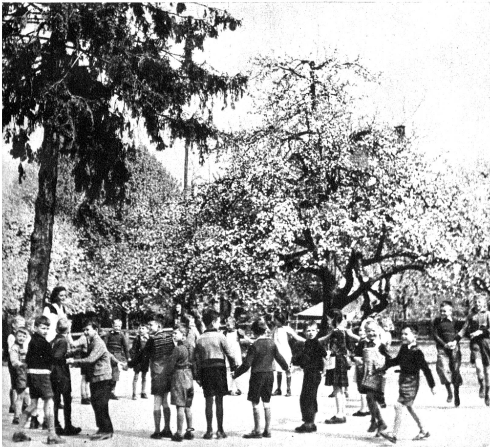
Unten: Turnstunde der Unterschule auf dem Spielplatz beim Schulhaus