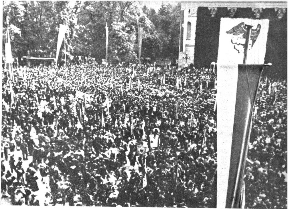
Rechts: Oesterreich ruft Südtirol! In einer mächtigen Kundgebung, aus allen Landesteilen Oesterreichs, vor allem aus den Tiroler Tälern besucht, wurde in Innsbruck die Rückgliederung von Südtirol an Oesterreich gefordert. Bundeskanzler Figl konnten 155 000 Unterschriften von Südtirolern zugunsten der Vereinigung übergeben werden.