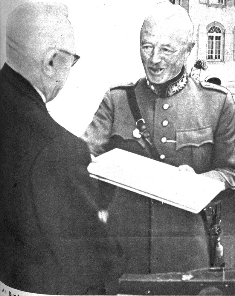
Alt Bundesrat Minger überreicht General Guisan die Ehrenurkunde