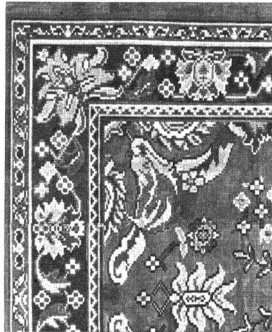
Jeder Orientteppich wird in tausende von winzigen Quadraten aufgeteilt, ehe er für die Industrie „kopiert“ wird. Für die Zeichnung und Kolorierung seines Entwurfes, der stets etwas vereinfacht, braucht der Kolorist Monate