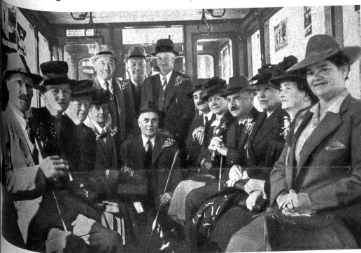
Am Morgen früh versammelten sich die 7 Jubilaren mit ihren Frauen beim Tramdepot Burgernziel, um von hier aus den schönen Tag zu beginnen

freuen sich die 7 Jubilaren jedes Jahr besonders auf diesen Tag, an dem sie in wohlverdienter Entspannung den Alltag vergessen und sich ganz ihrer jahrelangen Kameradschaft erfreuen dürfen. Sicher könnte jeder einzelne von ihnen uns Vieles erzählen, was er während den 38 Dienstjahren erlebt hat.