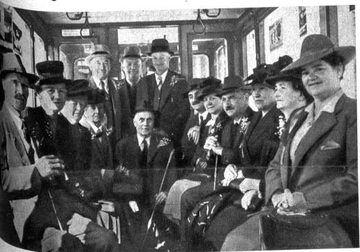
Am Morgen früh versammelten sich die 7 Jubilaren mit ihren Frauen beim Tramdepot Burgernziel, um von hier aus den schönen Tag zu beginnen

freuen sich die 7 Jubilaren jedes Jahr besonders auf diesen Tag, an dem sie in wohlverdienter Entspannung den Alltag vergessen und sich ganz ihrer jahrelangen Kameradschaft erfreuen dürfen. Sicher könnte jeder einzelne von ihnen uns Vieles erzählen, was er während den 38 Dienstjahren erlebt hat.