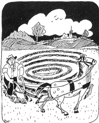
Das kommt davon, wenn man so'n blöden Zirkusgaul kauft