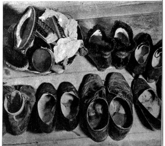
Manchmal braucht es ordentlich viel Mut, um sich an die Reinigung all der schmutzigen Schuhe zu machen

Hände die altgewohnten Griffe im Fels ertasteten, ein Stein sich löste und ihn an der Schläfe traf. Noch blieb ihm Zeit, ein paar rettende Schritte auf sicheren Boden zu tun, aber dann verliess ihn langsam die Kraft. Vielleicht hat er noch den Himmel betrachtet, den tiefblauen, sonniglichen, oder ein Stück Gletscher im Sonnenlicht, aber heimgekommen ist er nicht mehr.