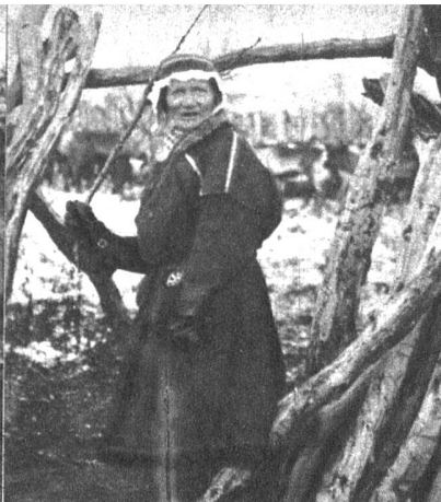
Hier wacht die Lappenfrau Partapouly über den Durchgang zur Familienkammer