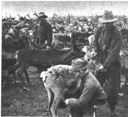
Eine Sommer-Renntierscheidung. Im Vordergrund ein Lappe beim Melken