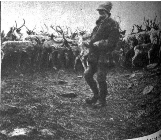
Mit dem Lasso warfbereit in der Hand lässt der Lappe die Rentiere um sich treiben und sucht sich seine Tiere