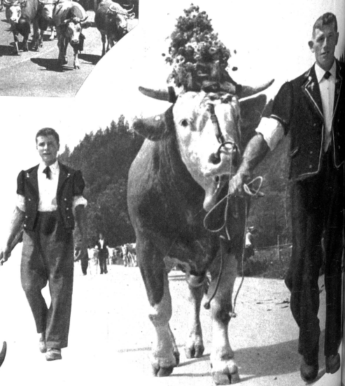
Der Leitmuni mit dem Melker führte den Zug