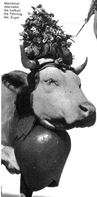
Manchmal übernahm die Führer die Führung des Zuges