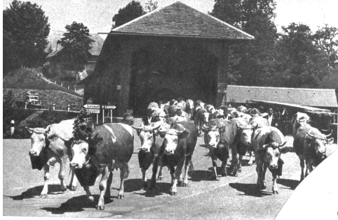
Der über 50 km lange Weg vom Tal auf die Alp führte über diese schöne alte Holzbrücke