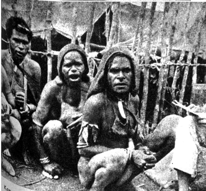
Kapauko-Leute erklären die Namen ihrer Gebrauchsgegenstände

im Innern der Insel zu dem den Alpen ähnlichen Nassau- und Carstenszgebirge an, einem gewaltigen Bergmassiv mit Gletschern, Firn und mächtigen Felspyramiden mit ewigem Schnee. Die höchsten Gipfel, deren Erstbesteigung erst vor einigen Jahren dem Holländer A. Colijn gelang, erreichen Höhen von 5000 Meter und mehr.