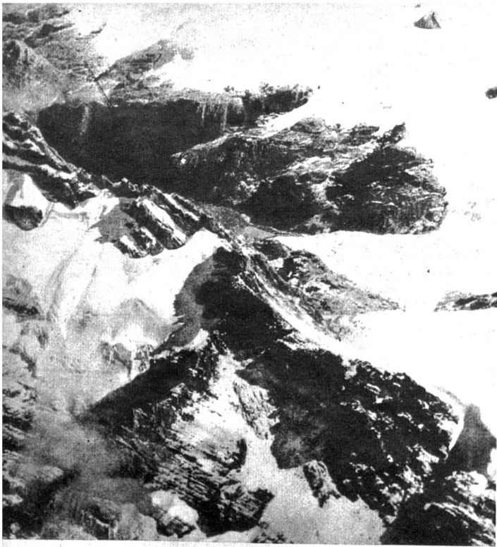
Der Carstenzfirn (ca. 5000 m ü. M.) im Nassau-Gebirge)