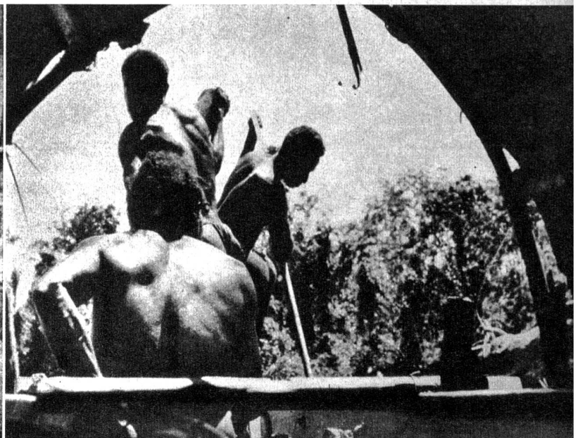
Transport auf dem Otomonfluss, Süd-Neu-Guinea