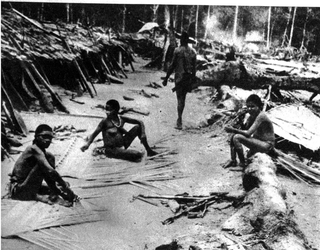
Unten: Strandwohnungen der Küstenpapuas in der Umgebung von Aika (Südküste)