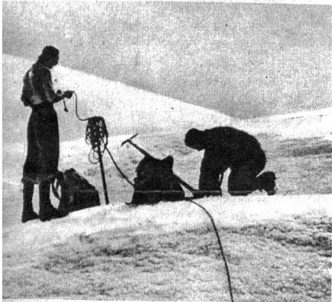
Links: A. Colijn bei der Erstbesteigung der höchsten Gipfel Neu-Guineas