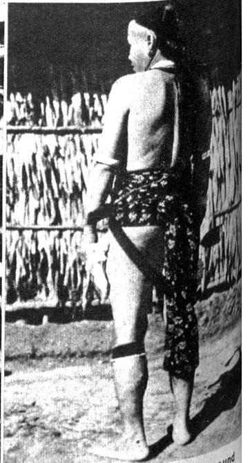
Die Dajaker aus Borneo werden als Träger und Pfadsucher bei Expeditionen besonders geschätzt und bis nach Neu-Guinea mitgenommen. Sie sind intelligent, ausdauernd und treu

U nter den südostasiatischen Inseln bildet Neu-Guinea die Brücke vom asiatischen zum australischen Kontinent. Besonders im letzten Kriege ist ihre Bedeutung als Stützpunkt für alle