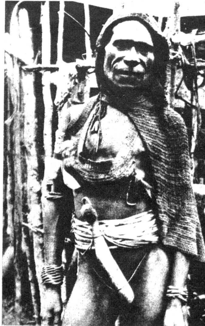
Kapauko-Mann, ein Bewohner des Hinterlandes am Fusse des Carstenz-Gebirges