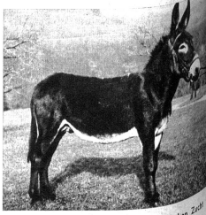
Der Eselhengst Bono aus der königlichen Zucht von Marlino-Franca