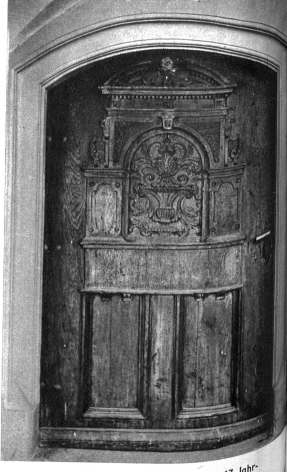
Vorstülpige Barocktüre des Hauses Kesslergasse 2, an der fehlende Türklopfer sollte ersetzt werden