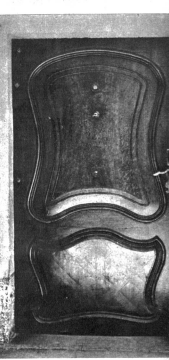
Türe mit schöner ruhiger Flächenaufteilung des Hauses Kirchgasse 14. Solche Türen kann man noch mehrmals in den Gassen unserer Stadt finden