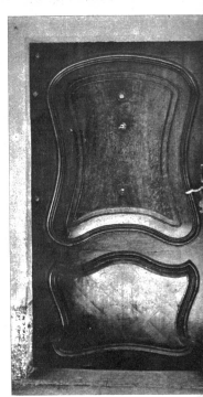
Türe am Haus Postgasse 44, mit schöner Holzbearbeitung und weit auflodernden Liniendurchführung