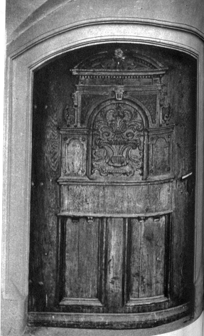
Vorstülpige Barocktüre des Hauses Kesslergasse 2, an der fehlende Türklopfer sollte ersetzt werden