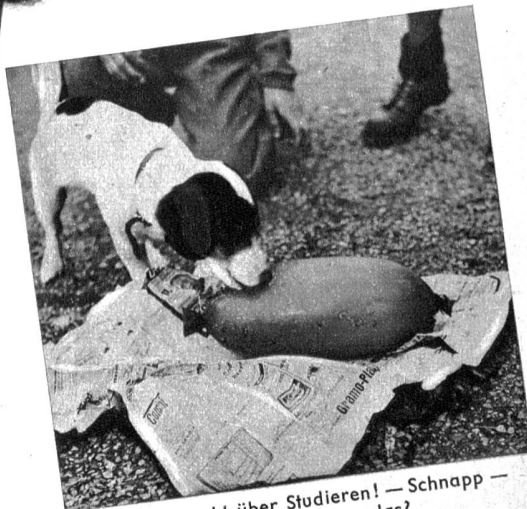
Probieren geht über Studieren! — Schnapp — Was ist denn nun das?