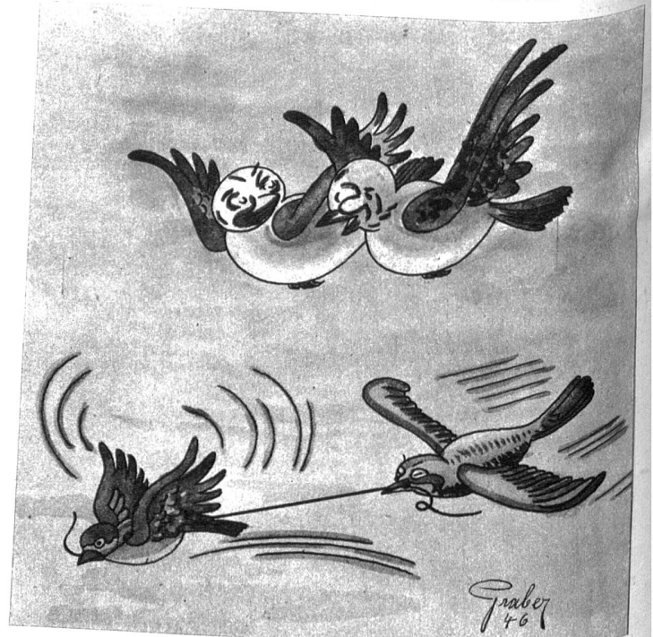
„Das haben sie den Fliegern in Dübendorf abgucken. .!“