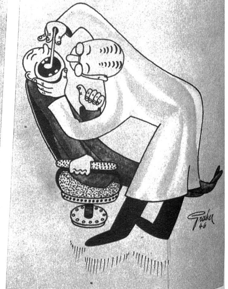
Beim Zahnarzt: „Auf welcher Seite essen Sie?“ - „Gegenüber vom Bahnhof!“