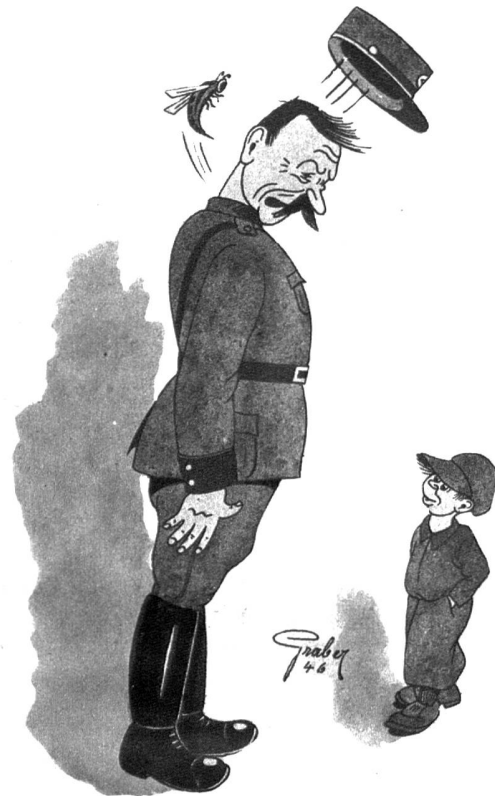
„Herr Polizist, die Wespe müssen Sie verhaften - wegen Beamtenbestechung!“