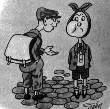
„Das ist kein Bonbon, das ist von den Zahnschmerzen“

1. Cimo, 2. Iran, 3. Marabu, 4. Onager, 5. Bedarf, 6. Urania, 7. rien, 8. Fant