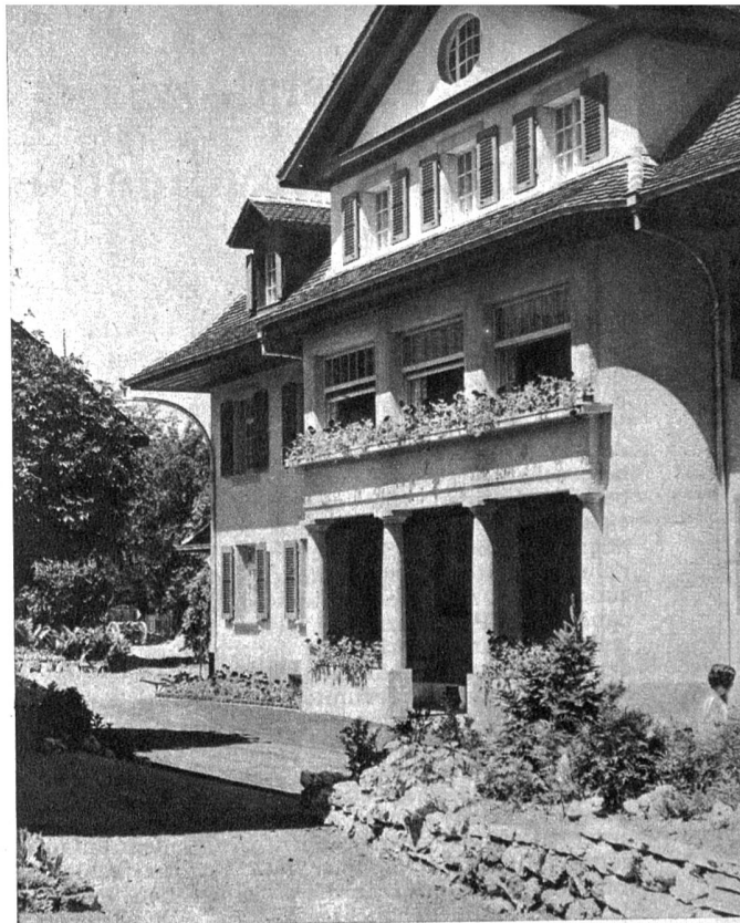
Eingang zu einem der Häuser des Nervensanatoriums