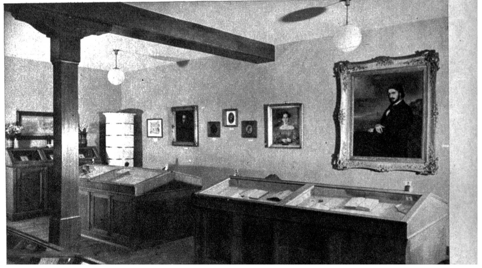
Unten: Blick in das Herwegh-Archiv mit dem Gemälde von Konrad Hitz: Georg Herwegh am Zürichsee, 1843