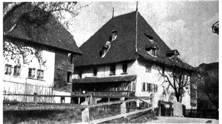
Die Höchhäuser in Steffisburg, über deren Ursprung man nicht genau Bescheid weiss