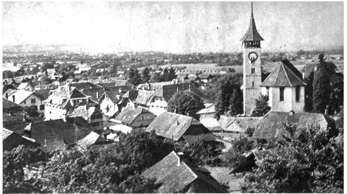
Kirche und Dorfpartie von Steffisburg

Die Bewohner des aufblühenden und gewerblichen Fleckens Steffisburg waren nicht besonders zufrieden, als die Station der BTB in die Bernstrasse, zwei Kilometer von der Kirche entfernt, zu stehen kam. Nun haben sie sich allerdings mit dem Schicksal ausgesöhnt, indem seit 10. Oktober 1913 die Strassenbahn Steffisburg-Thun-Interlaken die Tramwagen bis zum Landhaus fahren lässt. Vorher kursierten sowohl durch das Glockental wie auch die Bernstrasse Pferdeposten. Und noch früher, d. h. bis zum Jahre 1750, als die Zollhausbrücke auf die Zulg beim Siechenhaus versetzt war, ging der Verkehr zwischen Thun und