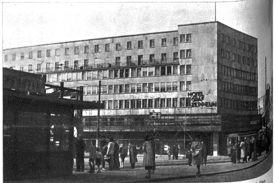
Das bekannte Hotel «Graf Zeppelin» in Stuttgart wird immer mehr zu einem inoffiziellen Hauptquartier ausgebaut