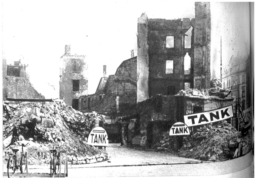
Tankstelle in Frankfurt

Dieser Schlosspark Stuttgarts nun ist ein Stück Dschungel. Nicht nur deshalb, weil die Büsche wuchern und das Gras längst zur Wiese geworden ist, weil Bäume mit dem Sturm fallen und die Wege bei Regen zu Sümpfen werden, weil es richtige Sumpfwieher und versteckte Pfade gibt. Sondern in der Hauptsache deshalb, weil es in diesem Dschungel-Schlosspark von allerlei Dschungelbewohnern nur so wimmelt. Solche, die nur bei Tag erscheinen, solche, die nur bei Nacht den Bau verlassen. Dann jene, welche nur zu ganz bestimmten Stunden auftauchen, eine halbe Stunde verweilen und dann fluchtartig wieder verduften, um erst am kommenden