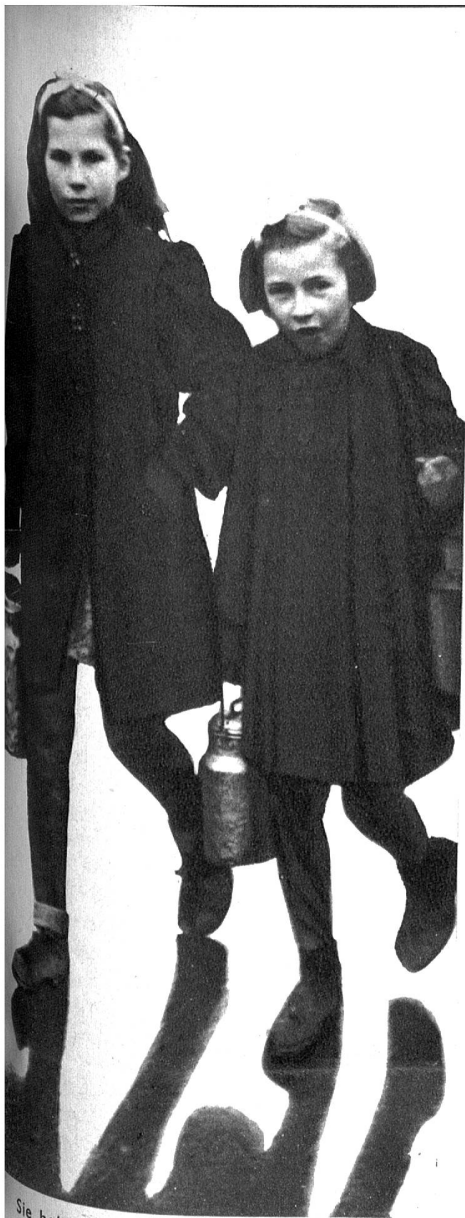
Sie holen für die ganze Familie Gemeinschaftsuppe