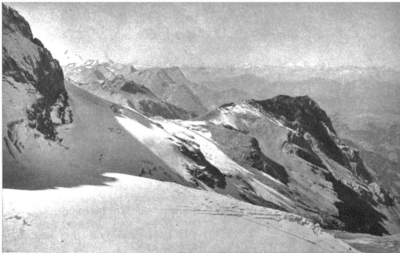
Mitte rechts: Der Nordwestgrat des Großstrubels