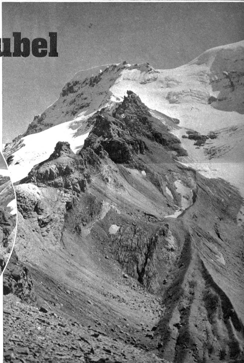
Kreis: Blick vom Ammerfenpass auf den Wildstrubel