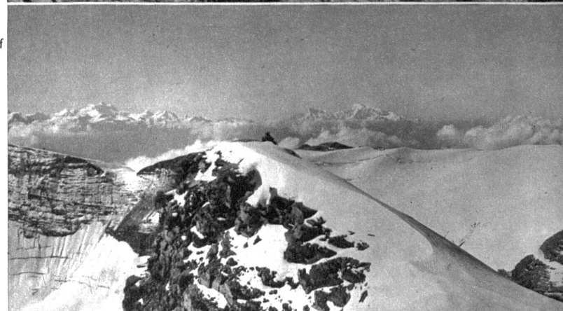
Rechts: Blick vom Gipfel des Großstrubels auf die Walliser Alpen