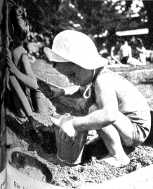
Ein kleines fleissiges Sandmännchen