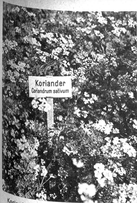
Koriander, Coriandrum sativum . Einjähriges Gewürzkräuter. Der Samen findet besonders in der Kuchenbäckerei als Gewürzbeigabe Verwendung. Als beliebtes Hausmittel dient Tee von den ausgereiften Samen