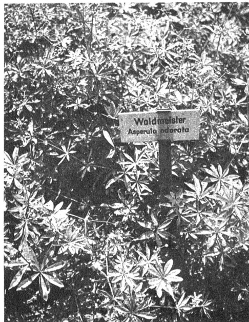
Waldmeister, Asperula odorata . In grossen Mengen vorkommende Waldpflanze, deren Blüte gerne für die Zubereitung von Bowlen gebraucht wird. Das Kraut dient als Mottenschutzmittel. Tee von den Blüten für den inneren Gebrauch