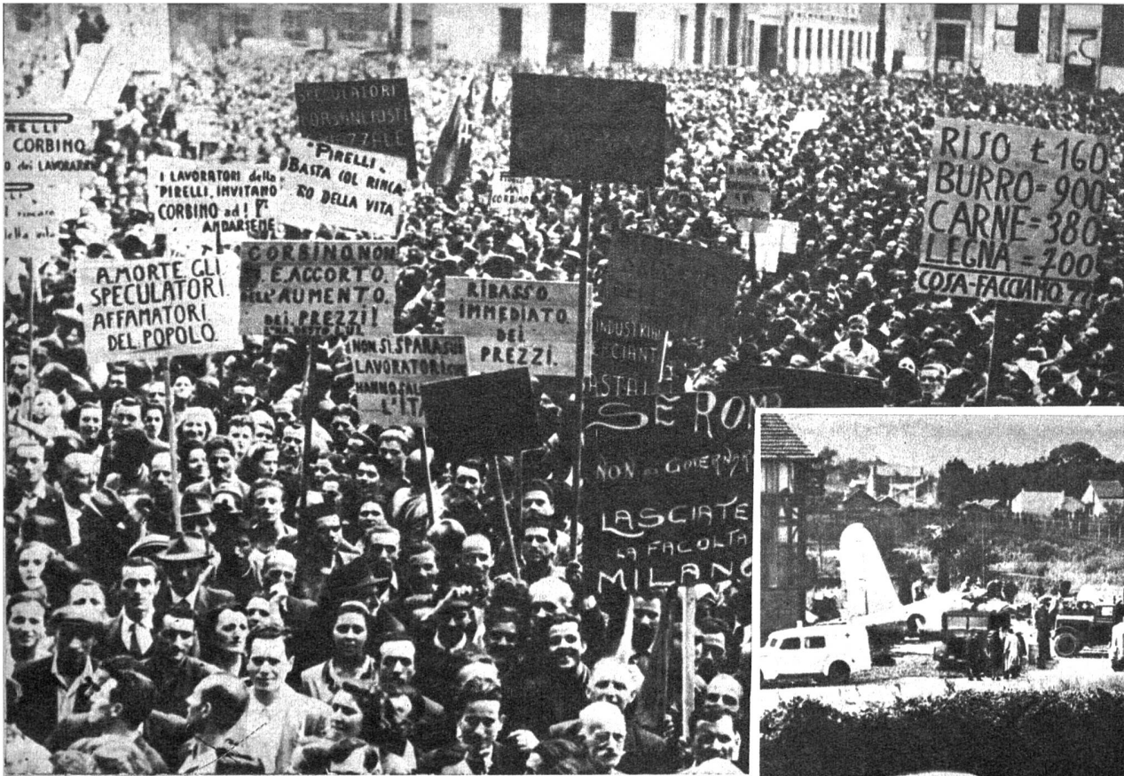
Links: Protest gegen den Schwarzhandel in Italien. Auf dem Mailänder Domplatz fand eine riesige Protestkundgebung gegen die Auswüchse des Schwarzhandels statt. Eine gewaltige Menschenmenge versammelte sich mit Plakaten aller Art, um gegen Spekulanten, Börsianer und die «Unfähigkeit der Regierung» einzulegen.