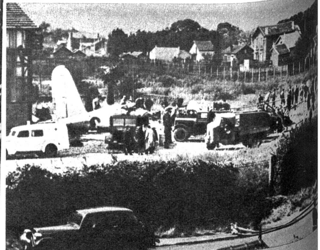
Rechts: Ein Kursflugzeug Paris-London abgestürzt, mehrere Tote. Kaum ist die Meldung vom schweren Flugunglück der Air France bei Kopenhagen publik geworden, als ein Passagierflugzeug der nämlichen französischen Luftverkehrsgesellschaft kurz nach dem Start in Le Bourget bei Paris kollidierte und abstürzte. Wiederum sind zahlreiche Tote zu beklagen. Unsere Bilder zeigen unten das Haus, mit dem die Maschine kurz nach dem Start kollidierte und oben die Absturzstelle mit den Maschinentrümmern