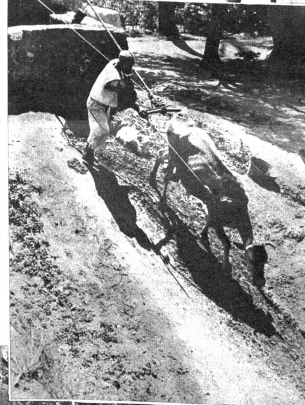
Rechts: Eine magere Kuh bildet den PS-Motor des Pumpwerkes. Daneben hat diese Kuh erst noch Milch zu geben

Wasser heisst Leben — und Leben ist alles, worauf es ankommt. Bei primitiven wie bei sogenannten zivilisierten und kultivierten Völkern scheint nur der Starke ein Recht auf Leben zu haben und da wie dort werden die Kriege grausam und rücksichtslos ausgetragen. Diese Kriege um Wasserrechte haben im Laufe der Zeit mehr Menschenleben gefordert als ein Weltkrieg mit seinen so und so viel Millionen Toten — und solange die Menschen in der Wüste leben werden, wird es weiterhin Kämpfe um Wasserrechte absetzen. Unsere Reportage zeigt einen libyschen Oasenbrunnen von der Art, um welchen solche Wasserrechtskriege ausgefochten werden. J. H. Mueller