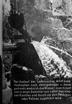
Der Auslauf des Ledersackes wird beim Hochziehen nach oben gebogen und dann gestreckt, wodurch das Wasser ausschiesst und in einen Sammler aus Lehm den kleinen Kanälen und durch sie den Feldchen oder Palmen zugeführt wird

Wasser heisst Leben — und Leben ist alles, worauf es ankommt. Bei primitiven wie bei sogenannten zivilisierten und kultivierten Völkern scheint nur der Starke ein Recht auf Leben zu haben und da wie dort werden die Kriege grausam und rücksichtslos ausgetragen. Diese Kriege um Wasserrechte haben im Laufe der Zeit mehr Menschenleben gefordert als ein Weltkrieg mit seinen so und so viel Millionen Toten — und solange die Menschen in der Wüste leben werden, wird es weiterhin Kämpfe um Wasserrechte absetzen. Unsere Reportage zeigt einen libyschen Oasenbrunnen von der Art, um welchen solche Wasserrechtskriege ausgefochten werden. J. H. Mueller