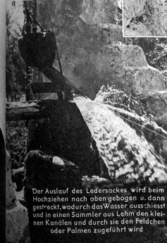
Der Auslauf des Ledersackes wird beim Hochziehen nach oben gebogen und dann gestreckt, wodurch das Wasser ausschiesst und in einen Sammler aus Lehm den kleinen Kanälen und durch sie den Feldchen oder Palmen zugeführt wird

Wasser heisst Leben — und Leben ist alles, worauf es ankommt. Bei primitiven wie bei sogenannten zivilisierten und kultivierten Völkern scheint nur der Starke ein Recht auf Leben zu haben und da wie dort werden die Kriege grausam und rücksichtslos ausgetragen. Diese Kriege um Wasserrechte haben im Laufe der Zeit mehr Menschenleben gefordert als ein Weltkrieg mit seinen so und so viel Millionen Toten — und solange die Menschen in der Wüste leben werden, wird es weiterhin Kämpfe um Wasserrechte absetzen. Unsere Reportage zeigt einen libyschen Oasenbrunnen von der Art, um welchen solche Wasserrechtskriege ausgefochten werden. J. H. Mueller