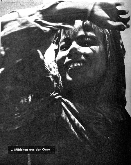
Mädchen aus der Oase