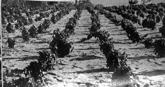
Ohne Wasser wächst hier nicht einmal Wüstengras — mit Wasser aber gedeihen hier Reben und Getreide