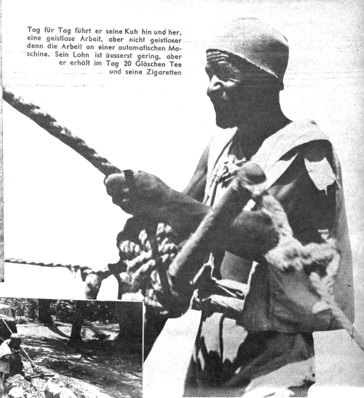
Tag für Tag führt er seine Kuh hin und her, eine gelistete Arbeit, aber nicht gelisteter denn die Arbeit an einer automatischen Maschine. Sein Lohn ist äusserst gering, aber er erhält im Tag 20 Gläschen Tee und seine Zigarretten