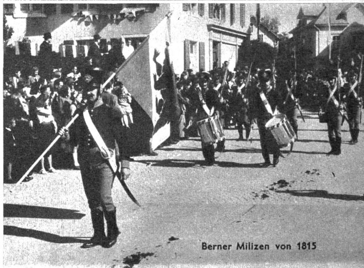
Berner Milizen von 1815