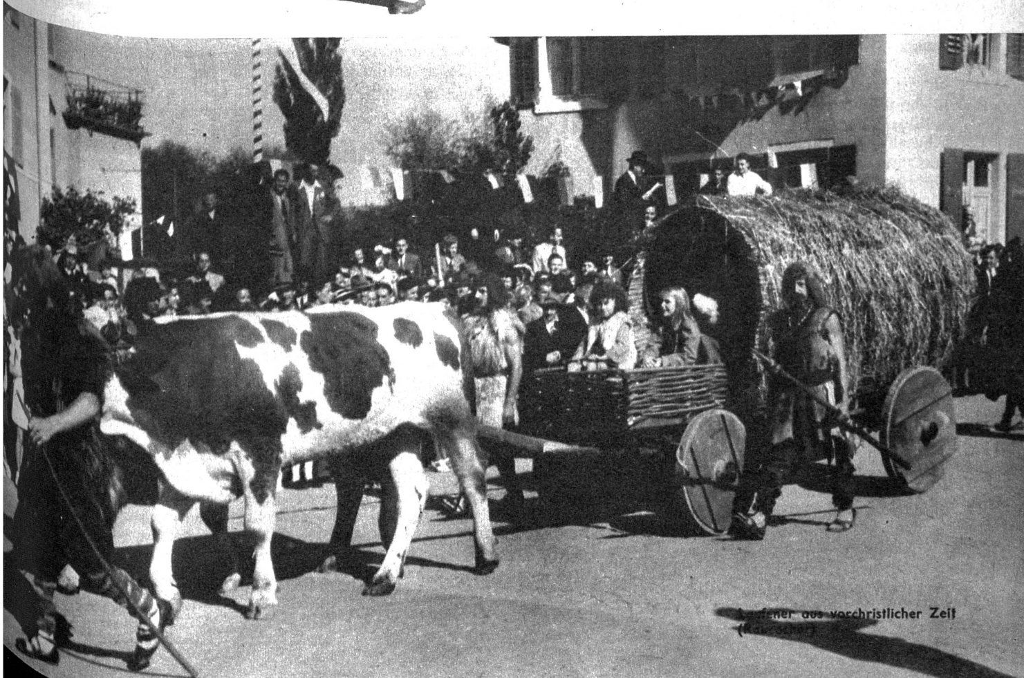
Laufener aus vorchristlicher Zeit