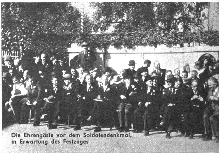
Die Ehrengäste vor dem Soldatendenkmal, in Erwartung des Festzuges