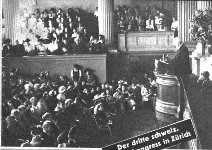
Der dritte schweiz. Frauenkongress in Zürich