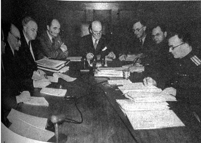
Am Anfang der vergangenen Woche ist das alliierte Militärtribunal in Nürnberg zum letzten Male zusammengetreten, um im Besein prominenter Persönlichkeiten aus dem politischen und militärischen Leben der alliierten Nationen den Urteilsspruch gegen die 21 deutschen Hauptkriegsverbrecher zu verkünden. Unser Bild zeigt die Männer, welche die Kriegsverbrecher verurteilten