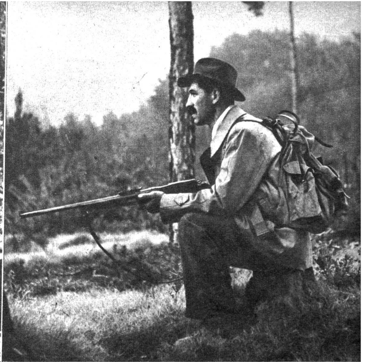
Die Jäger hatten ihre Standorte gut gewählt; sie waren schussbereit. Aber nichts liess sich blicken, bis schliesslich die Treiber erschienen. Von den Panthern fehlt aber jede Spur