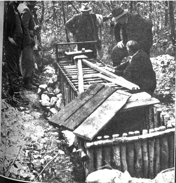
Ziegen, Hühner und sogar einen Esel sperrte man in sinnreich angelegte Fallen; die «freiwilligen» Opfer blieben aber unversehrt (ATP)