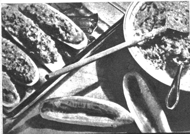
Gurken werden von den Kernen befreit und gefüllt