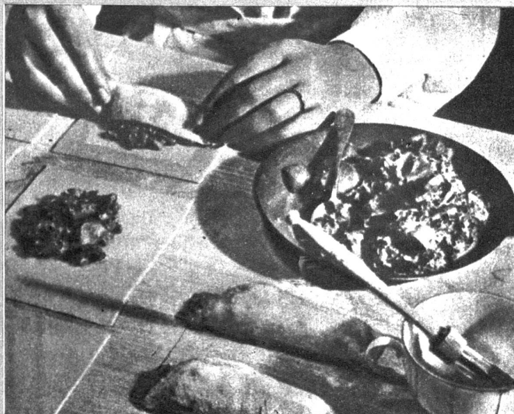
Gefüllte Pilztaschen: die Pilzmasse wird in Teig eingewickelt