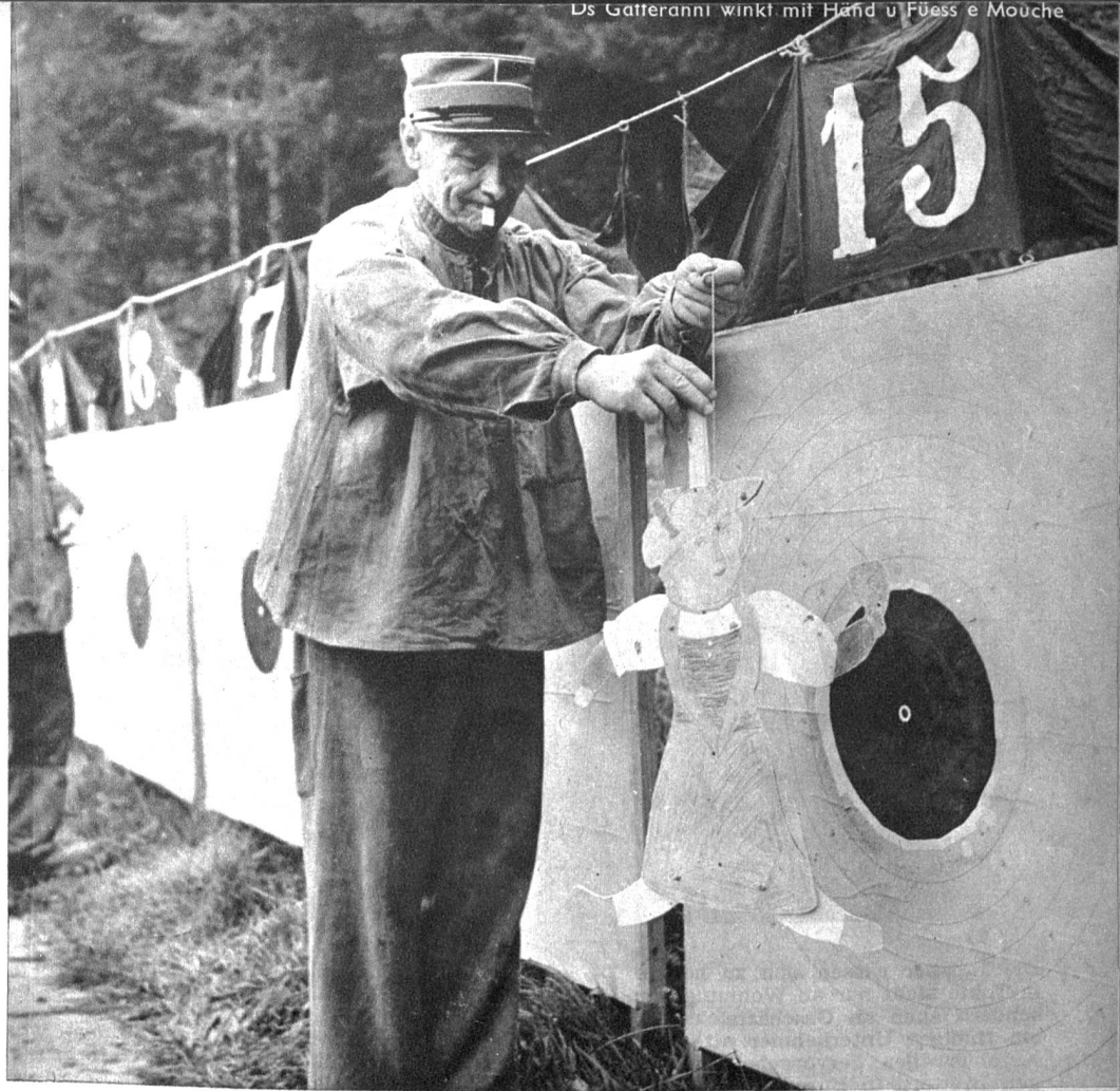
Ds Gatteranni winkt mit Hand u Füess e Mouche

von einem Mitglied gestifteten, silbernen Berner Schützenbrunnen' gewann. Die Resultate verursachen aber weder Erfolgskünkel noch Minderwertigkeitsgefühle. Die Gesellschaft ist ja das einzige, umfassende Bindeglied in der Bürgergemeinde, hier pflegen die Stubengenossen der vierzehn burgerlichen Gesellschaften und die nichtzünftigen Bürger ohne Ansehen ihrer politischen Farbe, Wehrfähigkeit und frohe Kameradschaft. Auch diesmal trafen sich abschliessend die Schützen und einige Verspätete im Thalgut beim Nachessen, wo Handwerker und Akademiker, Füsilier und Oberst, Patrizier und Neubürger in froher Geselligkeit die Gläser klingen liessen.