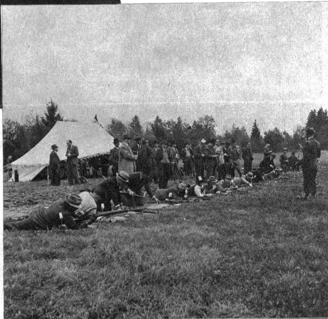
Das isch nid öppe ds Zält vom Zirkus Knie, nei, hie chouft me d'Chrugli u ds Z'vieri

Geschossen wird in der Regel auf überlieferte Scheibenbilder. Mouchen werden mit dem «Gatteranni» gezeigt, Durchschnittsresultate unter 40 bei 50er-Scheiben stehen jeweils weit unter dem Gesellschaftsmittel. Bei grösserer Munitionsteilung wird auch das traditionelle Wurstschiessen, Schyblischiessen und das