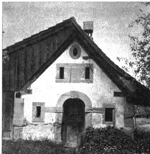
Rechts aussen: Partie an der Sense. Die Gemeinde Köniz wird auf einer kleinen Strecke von der Sense begrenzt. Rechts: Altes Ofenhaus in Liebewil

Das het gnützt. Es isch gar nit lang gange, het me e Lychehalle i Friedhof gstellt, un im neue Gemeinhaus isch 1899 undenninn es Arräst-sokal ygrichtet worde.