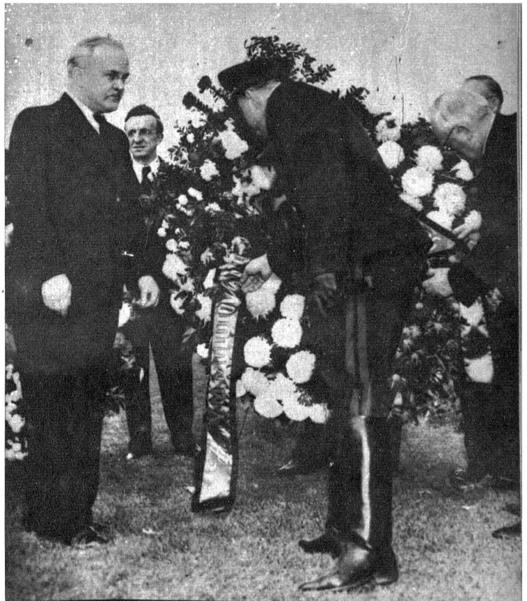
Im Rahmen der derzeitigen UNO-Konferenz begab sich Außenminister Molotow in Begleitung seines Stellvertreters Wischinsky an das Grab Roosevelts im Hayde-Park, wo sie einen Kranz niederlegten.