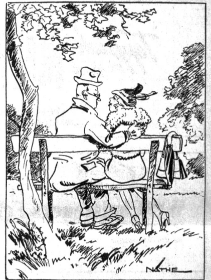
«Um ganz aufrichtig zu sein, Liebste, du bist nicht die erste die, ich geküsst habe.» — «Dann will auch ich aufrichtig sein, du hast noch viel zu lernen.»