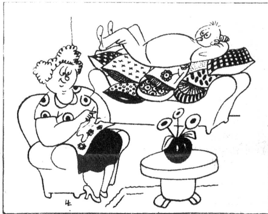
Ausdauer: «Was nächst du eigentlich?» — «Ich bin dabei, ein Sofakissen zu nähern.» (Söndagsnisse-Strix)