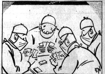
Der Operationstisch, einmal anders «ins Licht gerückt». («London Opinion»)