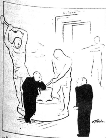
«Sag mal, Smith, könntest du nicht wo anders anlehnen? Mich macht das so nervös...» («The New Yorker»)