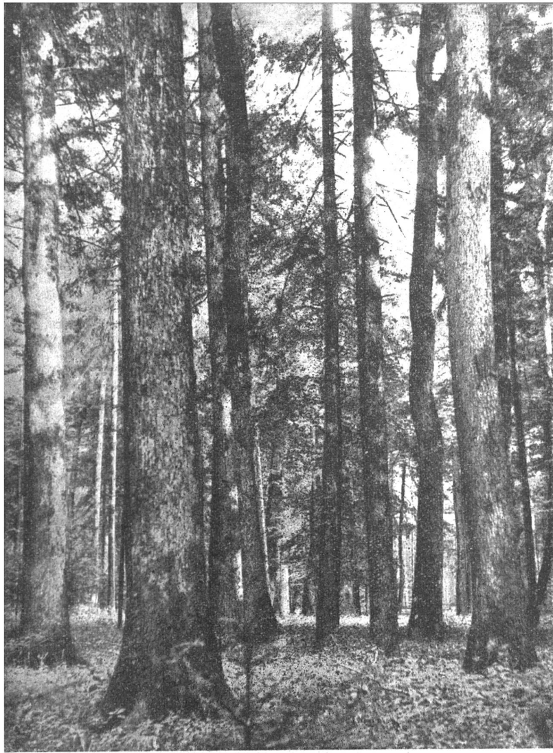
Moosecken. 135jährige Eichen mit Fichte und Tanne als Nebenbestand. Naturverjüngung. Zuwachs 15,4 cbm pro Hektare.

in zahlreicher Mischung der verschiedenen Holzarten und Altersstufen. Waldbestände, die nach heutiger Erfahrung und wissenschaftlicher Erkenntnis grösste und wertvollste Holzträge abwerfen. Den Lebensgewohnheiten der einzelnen Holzarten entsprechend, besiedelt die Buche hauptsächlich die oberen Hangpartien, die andern Laubhölzer mehr die untern Hanglagen mit den oft zahlreichen Sickerwasserhorizonten; auf dem Plateau und an den Süd- und Osthängen sind nun wunderschöne Mischwälder herangewachsen mit vorwiegend Buche, Rottanne und Weisstanne. Wie mächtige Säulen ragen die formschönen Nadelhölzer zum Himmel empor. Die Laubhölzer und zahlreiche Nadelholzjungwüchse durchwachsen den ganzen Luftraum vom Boden bis zu den Kronen und geben dem Bestande Aussehen und Charakter einer ewig lebenden, aus seiner eigenen Kraft heraus sich stets erneuernden volkshaften Lebensgemeinschaft. Jeder Baum kämpft um den Platz an der Sonne; ohne genügend Licht muss jeder sterben; so ist in der Lebensgemeinschaft Wald der Kampf ums Licht kurzweg der Kampf ums Leben überhaupt. Der Forstmann hat diesen Lebenskampf zu überwachen, durch ständiges Eingreifen in das Bestandesleben hat er das Gleichgewicht der Kräfte im Sinne der erwünschten Entwicklung zu erhalten.