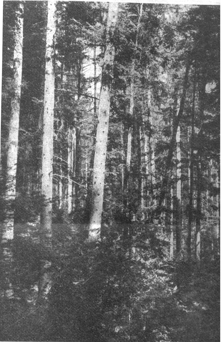
Hinterer Moosrain. Gemischter ungleichaltriger Bestand von vorwiegend Fichte, Tanne, Buche mit sehr hohem Holzvorrat von 600 cbm pro Hektare.

In mannigfaltiger Abwechslung reiht sich nun im Verlauf der Wanderung Bild an Bild, jedes von besonderer Eigenart. Die «Hagendornen» mit den nahezu 150jährigen Eichen und der bereits stark in Entwicklung begriffenen zweiten Generation Nadelholz; junge und jüngste Eichenkulturen im Säuhubel, wo zur Zeit kranke, aufgelöste Rottannenbestände aus der Kahlschlagzeit in naturgemässe Bestockung umgewandelt werden; das überaus schöne Eichenstangenholz des «Säueinschlages»,