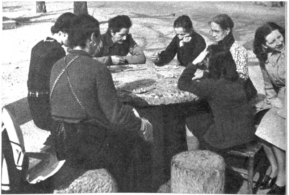
«La tumbula» spielen die Leute in den Tessiner Dörfern, meistens Frauen, an den Sonn- und Festtagen. Im lockeren Kreis sitzen sie, oft nur auf der Erde, oft nur um einen steinernen Tisch herum, der in Bissone wie gemacht für dieses Lottospiel zu sein scheint