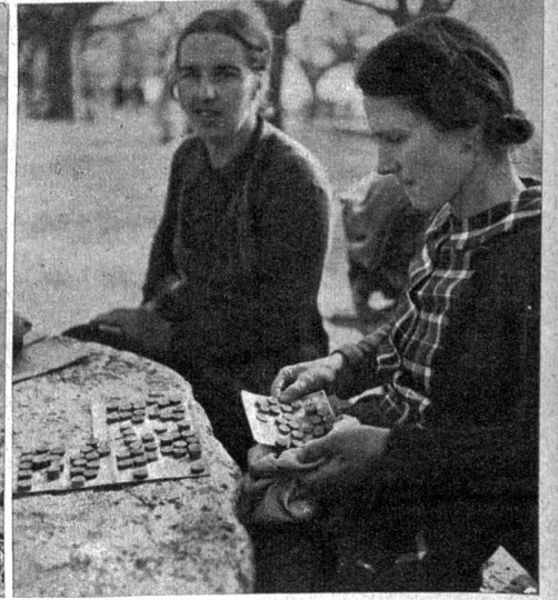
Das Spiel ist aus. Die Ausruferin legt die Nummern wieder in ihren Sack und beginnt von neuem