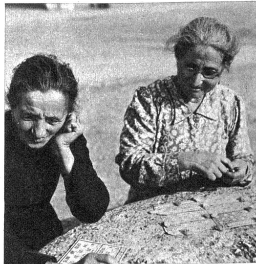
Jede der Spielerin sucht sich ein paar Steine zusammen, zum Bedecken der abgerufenen Nummer