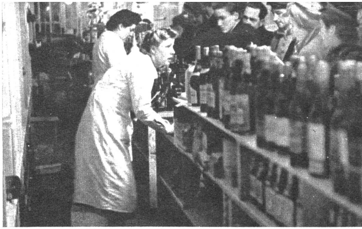
Links: Die Verkäuferinnen müssen den ganzen Tag Red und Antwort stehen und haben alle Hände voll zu tun, so dass sie am späten Abend todmüde ins Bett sinken