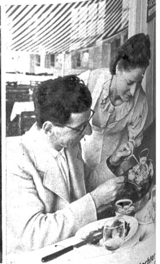
Unermüdlich ist die Serviertochter auf den Beinen und hat den Kopf voll Bestellungen, die möglichst rasch erledigt werden sollten, um die festliche Kundschaft zu befriedigen