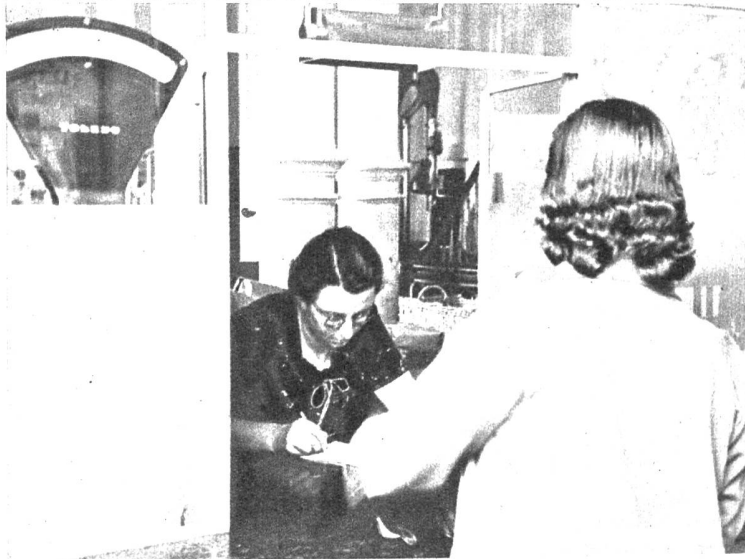
Rechts: Der Schalterbeamte der Bahnen hat an solchen Tagen nichts zu lachen, weil alles zu gleicher Zeit verreisen will, um die Festtage andernorts zu verbringen