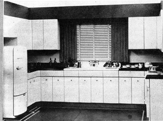
Die Musterküche amerikanischer Konstrukteure, die nach den Angaben von 10 000 Hausfrauen gebaut wurde. Dank den kleinen Türen, die sich durch einfaches Drücken der Knöpfe öffnen, kann die Hausfrau ihre Arbeit bequem sitzend verrichten.